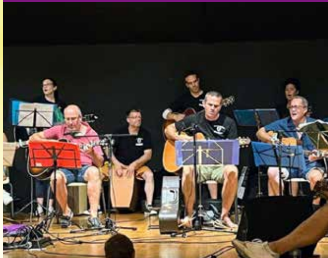
Les Gratteux Ussacois.