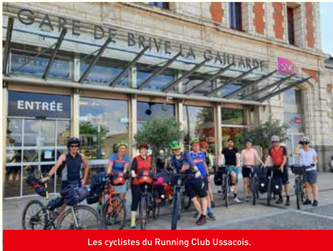
Les cyclistes du Running Club Ussacois.

La reprise se fera en douceur pour les athlètes du Running Club Ussac. L'objectif est de retrouver de bonnes sensations.