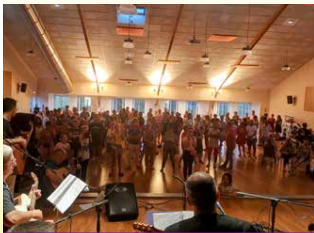
Le public était nombreux à la fête de la musique.